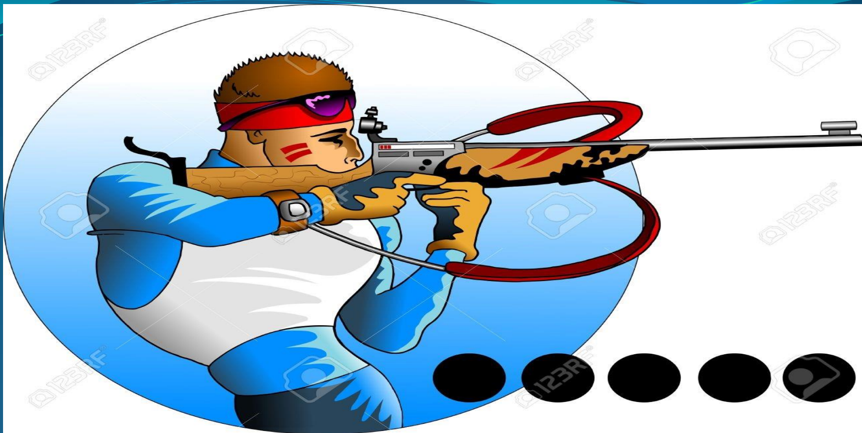
Пневматическая спортивная винтовка «Пионер -У» (Апгрейд МР- 61)